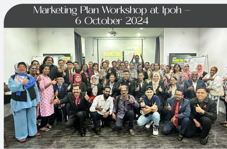
Marketing Plan Workshop at Ipoh – 6 October 2024