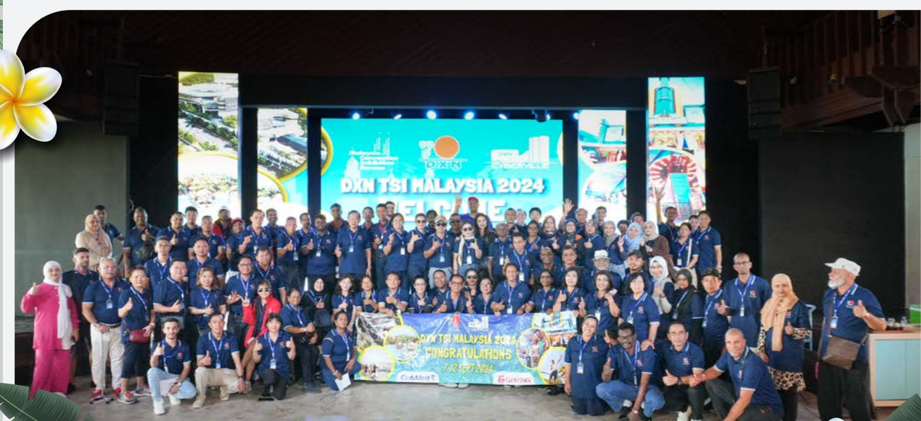
TSI 2024 CLUB MED CHERATING