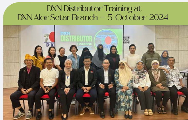
DXN Distributor Training at DXN Alor Setar Branch – 5 October 2024