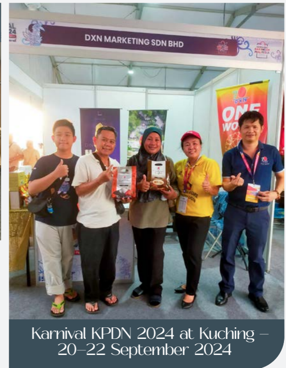
Karnival KPDN 2024 at Kuching – 20–22 September 2024