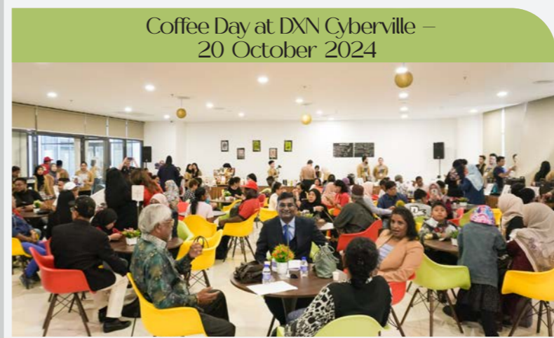
Coffee Day at DXN Cyberville – 20 October 2024