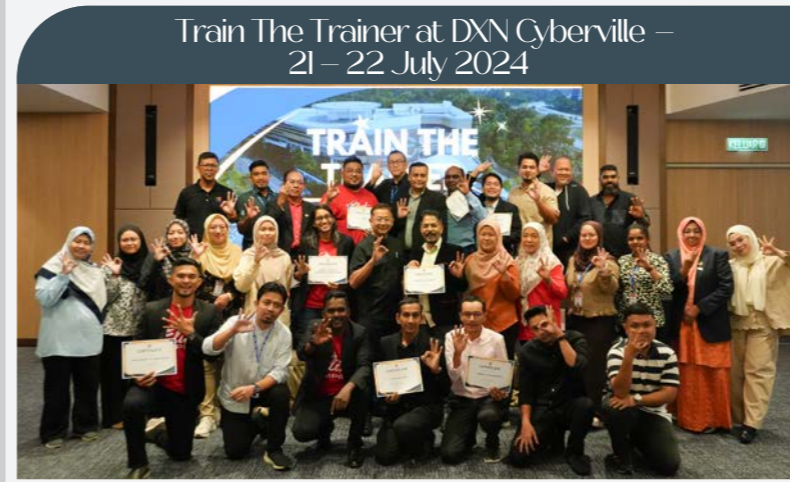
Train The Trainer at DXN Cyberville – 21 – 22 July 2024