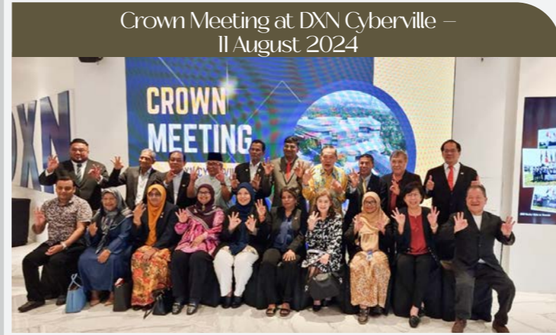
Crown Meeting at DXN Cyberville – 11 August 2024