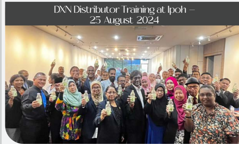
DXN Distributor Training at Ipoh – 25 August 2024