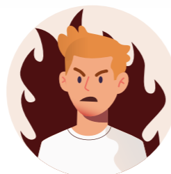
Angry 愤怒 Marah