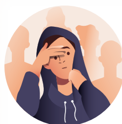
Anxious 焦虑 Resah