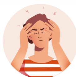
Irritable 易怒 Mudah marah