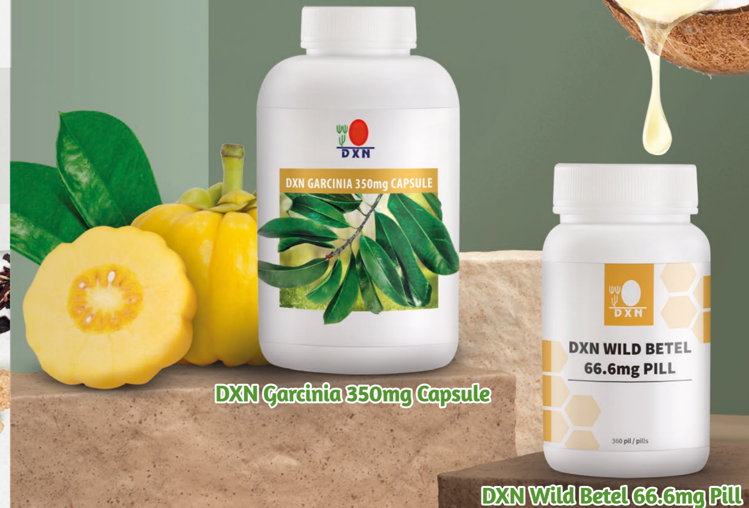
DXN Garcinia 350mg Capsule