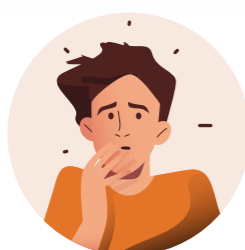
Fear 恐惧 Takut