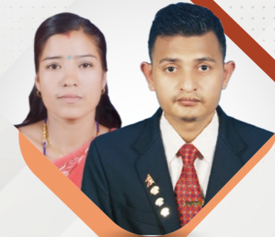
SUVAN NEPALI NEGERI SEMBILAN