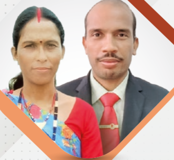
BHUWAL KHOIRI PERAK