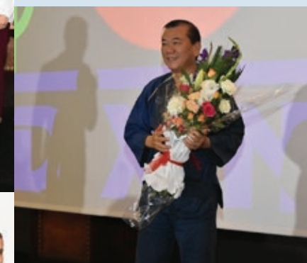
The Grand Opening of DAXEN Morocco, July 2019