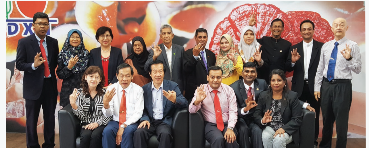
DXN PJ Crown Gathering