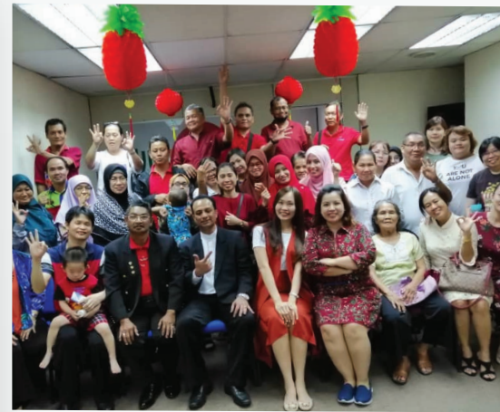
Chinese New Year Gathering - Kuching Branch