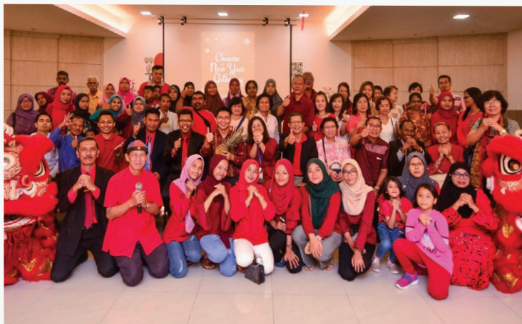
Chinese New Year Gathering - Alor Setar Branch