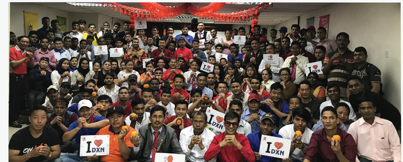
Chinese New Year Gathering - JB Branch