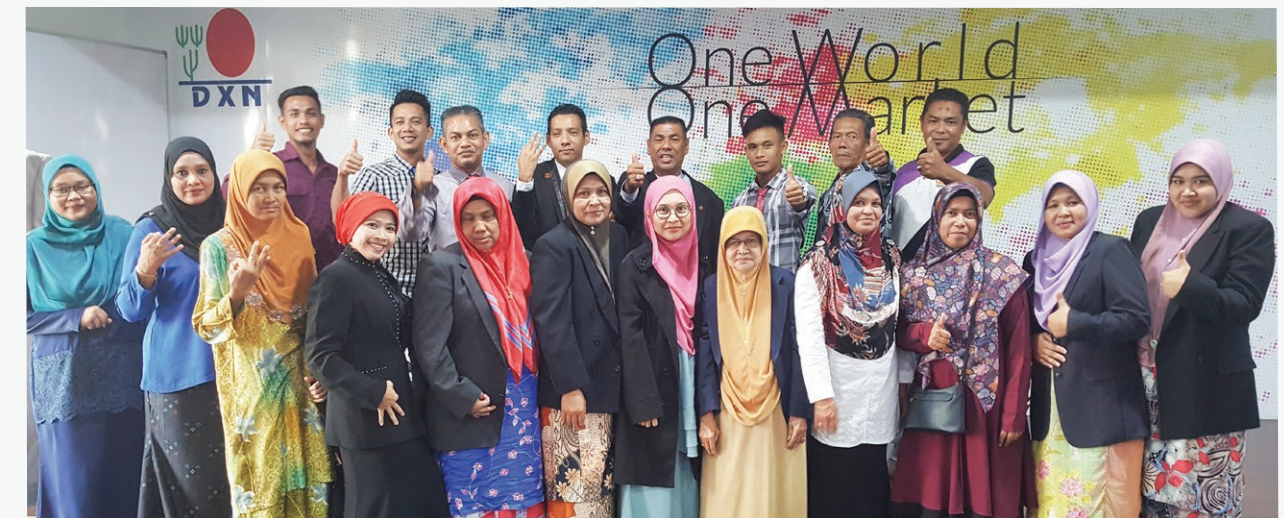
DXN Basic Ganotherapy Workshop