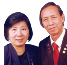
SOM DED A/L NAI MAR (KEDAH)