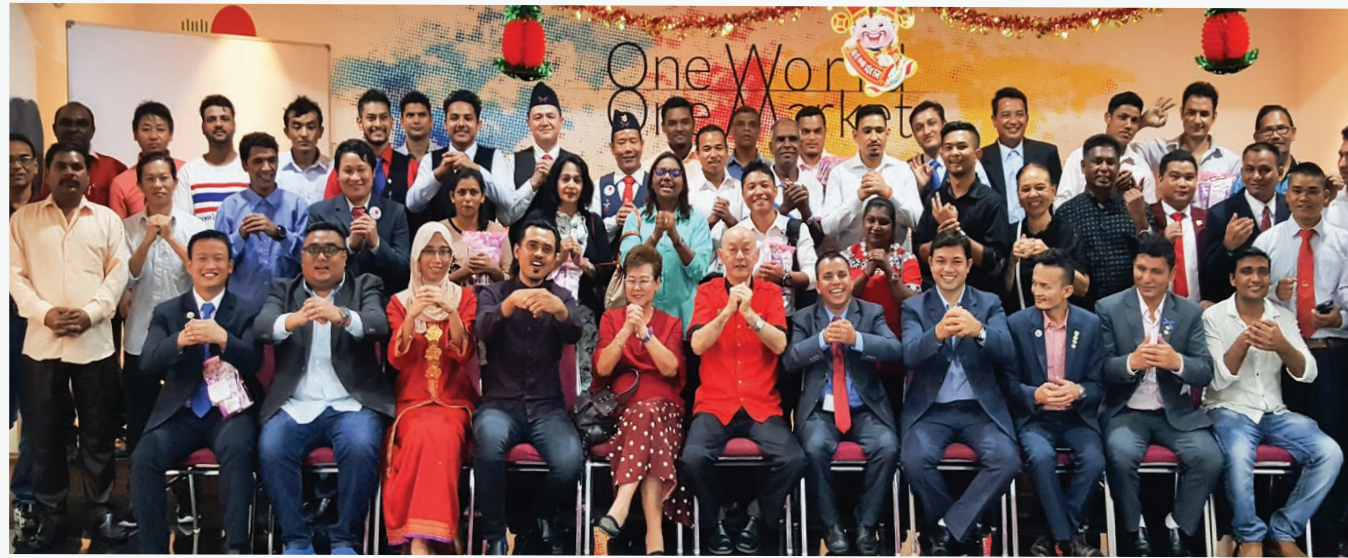
Chinese New Year Gathering - PJ Branch