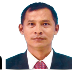
SUK BAHADUR THING (JOHOR)