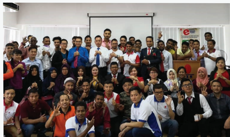
Chinese New Year Gathering - Penang Branch