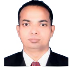
HARI SAH (PULAU PINANG)