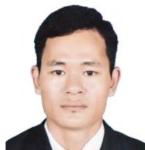
SANTOS LIMBU (PULAU PINANG)